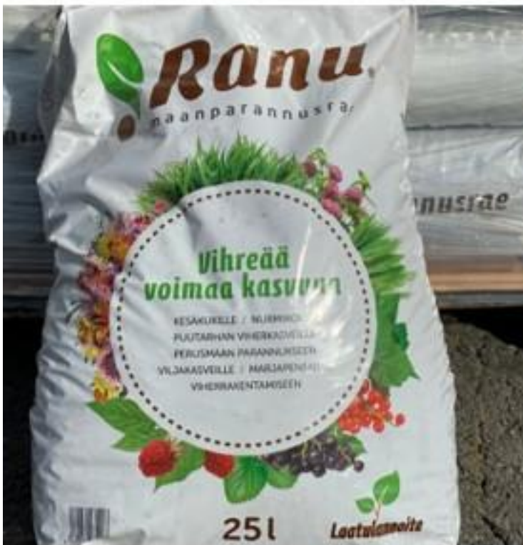
Kuva 2: Ranu-maanparannusrae-valmisteen myyntipakkaus.